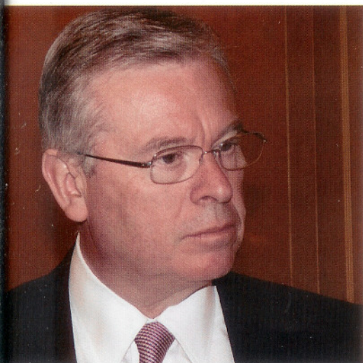
De voormalige EU-Commissaris voor Volksgezondheid was, David Byrne de gastspreker.